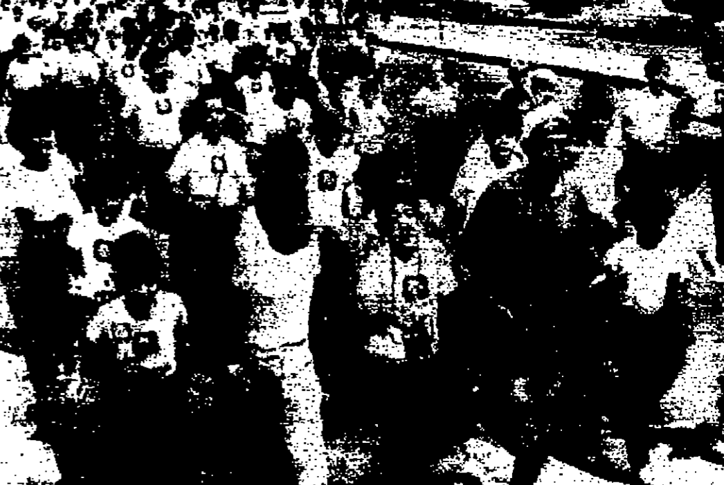
مؤامرة القتل في القرية الريفية بمدينة مكسيكو والمدام السويسري هيلموت كونيسك يعملان مع فتيان في المخيم العالمي لاقبالين من قضي المسجونين بمناسبة الدورة الاربعة التي تبدأ غدا (صورة لاسمكة من اليونانيات)

لقد تم تعيين عن مركز عمك في قسم التشغيل والصيانة وذلك اعتباراً من ١٣-٩-١٩٦٨ ولم تعد إليه حتى الآن وعليه أنذر بالعودة إلى مركز عمك خلال ثلاثة أيام من تاريخه مع بيان أسباب تعيينك والا تعتبر مفصولاً عن مركز من ١٣-٩-١٩٦٨ وذلك عملاً بأحكام الفقرة (ج) من المادة (١٣) من قانون العمل المعدل رقم (٢) لسنة ١٩٦٥ المعدل للفترة (د) من المادة (١٧) من قانون العمل الأصلي رقم (٢١) لسنة ١٩٦٠ .